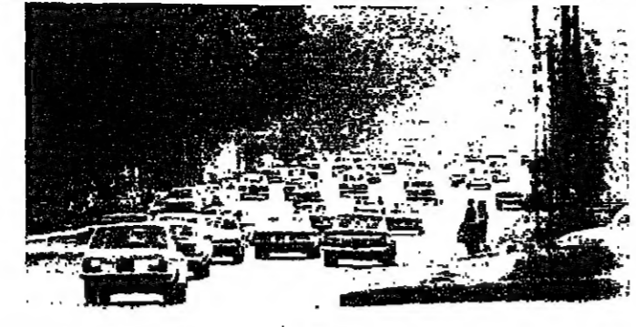
العودة من الجبال الى بيروت

من مراسل « الانوار » : اتيم مساء امس ، مهرجان شعبي في بلدة « العدوسية » بقيادة الزهراني ، حضره ممثلون عن القرية الفلسطينية والاجازات والفقرى الوطنية والتمتية وابناء منطقة الزهراني .